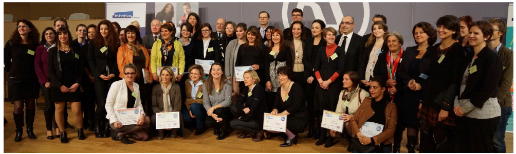
Remise des prix du concours Initiative Féminin, le mardi 2 décembre 2014

COMMUNIQUÉ DE PRESSE • Lyon, 3 Décembre 2014